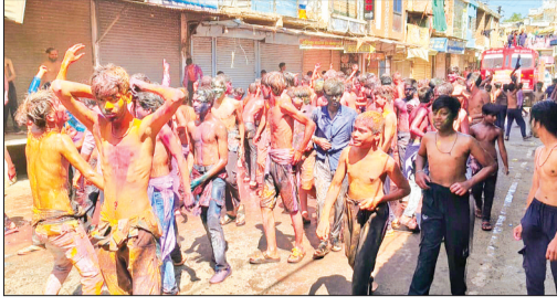
हरिभूमि न्यूज़ | आरोन

नगर में हर वर्ष की भांति इस वर्ष भी रंग पंचमी के पावन अवसर पर विश्व हिंदू परिषद एवं बजरंग दल के तत्वावधान में भव्य एवं विशाल गेर का आयोजन किया गया। इस अवसर पर पूरा नगर रंगों और उत्साह के माहौल में सराबोर नजर आया। गेर की शुरुआत सनकारिक आश्रम, आरोन से हुई, जहाँ बुजुर्ग, बच्चे और युवा सहित सभी वर्गों के लोग बड़ी संख्या में एकत्रित हुए। रंग और गुलाल उड़ते हुए तथा डीजे की मधुर धुनों पर उत्साहपूर्वक नृत्य करते हुए लोगों ने नगर में उत्सव का माहौल बना दिया। इस दौरान नगर परिषद की फायर ब्रिगेड द्वारा जुलूस में शामिल लोगों पर पानी की फुहारें छोड़ी जा रही थीं, जिससे युवाओं में और अधिक उत्साह देखने को मिला। रंगों और पानी की फुहारों के बीच युवा वर्ग मस्ती में झूमता रहा और एक-दूसरे को प्रेमपूर्वक गुलाल लगाकर रंग पंचमी की खुशियाँ मनाता नजर आया। यह भव्य गेर नगर के प्रमुख मार्गों इंदिरा पार्क, पुराना बस स्टैंड, गुलाब गंज चौराहा से होते हुए दास हनुमान मंदिर चौराहा पहुंची, जहाँ कार्यक्रम का समापन किया गया। कार्यक्रम के अंत में विश्व हिंदू परिषद एवं बजरंग दल के कार्यकर्ताओं ने आयोजन में शामिल सभी नागरिकों, प्रशासन एवं सहयोगियों के प्रति आभार व्यक्त किया।