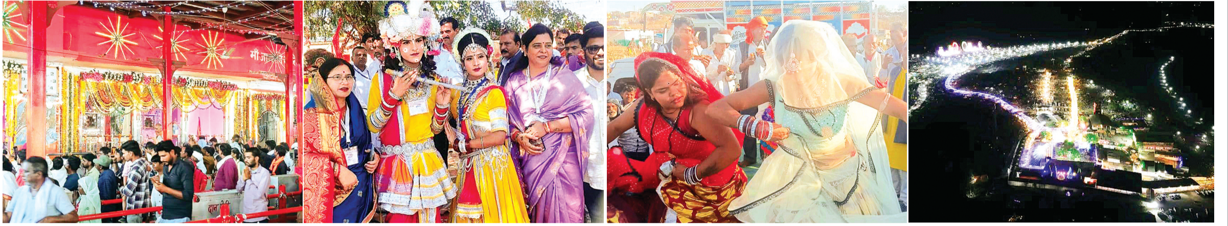
हरिभूमि न्यूज अशोकनगर

करीला अशोकनगर जिले की वह पवित्र और पावन भूमि है यहां लाखों श्रद्धालु प्रदेश के साथ पड़ोसी राज्य उत्तरप्रदेश और राजस्थान से यहां आते हैं, भीड़ का अनुमान लगा पाना मुश्किल है। हर वर्ष मेले में भीड़ बढ़ती जा रही है, मेले में आने वाले श्रद्धालुओं के लिए जो प्रबंध किए जाते हैं वह भी कम पड़ जाते हैं। यह आस्था का ही चमत्कार है कि यहां आने वाले श्रद्धालु माता के दरबार में माथा टेकते हैं और मनोकामनाओं की प्रार्थना कर अपने घरों को लौट जाते हैं। इस पवित्र पावन भूमि को लेकर जहां श्रद्धालुओं में उत्साह रहता है वहां नृत्यांगनाओं में भी व्यापक उत्साह देखने को मिलता है। अशोकनगर जिले के प्रसिद्ध करीला धाम में रंगपंचमी पर लगने वाले मेले को लेकर दो दृश्य देखने को मिले। एक भीड़ मेले में जा रही थी और दूसरी भीड़ मेले से आ रही थी। जिसको देखें से भी करीला धाम पहुंचने का मौका मिला वह वहां से करीला धाम पहुंचते हुए देखा गया। कई लोगों को पहाड़ों से उतरते हुए देखा गया। अनेक लोगों ने वाहनों के साथ आकर कहीं नहर के किनारे डेरा डाला, तो कहीं प्यास बुझाने के लिए लगाए गए नलों के पास नजर आए। तो अनेक लोगों को कोचा डेम की बेस्ट वेयर से बहकर आने वाले पानी में नहाते हुए देखा गया। यहां जितने भी भवन में वह सब आम जनो के लिए उपलब्ध नहीं थे। एक अधिकारियों का रेस्ट हाउस था। तो दूसरे का उपयोग पुलिस बल को रूकने के लिए किया गया था।