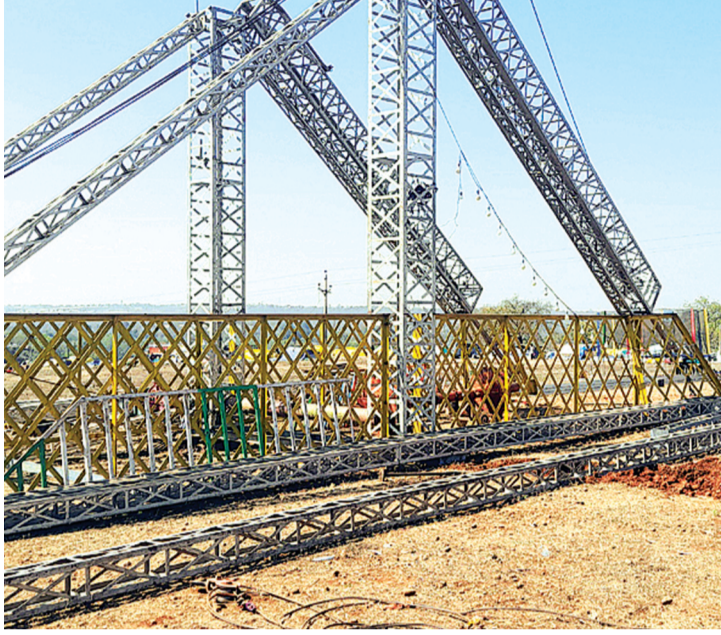
हरिभूमि न्यूज ►► ब्यावरा/राजगढ़

लेकिन हद तो जब हो गई कि वक्फ बोर्ड ने पूर्व की कमेटी के चार माह बाकी होने पर भी एक नई कमेटी पैराशूट से उतार दी। नव गठित कमेटी ने पूर्व कमेटी से अपना हिस्सा किताब मांगना शुरू कर दिया और पूर्व कमेटी के द्वारा किए गए सभी टेंडर को निरस्त करते हुए अपने निजी मंगलदंत कष्टमी बनाकर निजी स्वार्थ के लिए मंगलदंत टेंडर करना शुरू कर दिए। लेकिन जब मले का दिन करीब आने लगा तब ही शहर में सुरिलम समुदाय के लोगों ने रोस सा ज्ञा गया और दबी जुबान से सब वक्फ बोर्ड का विरोध करने पर उतारू हो गए।