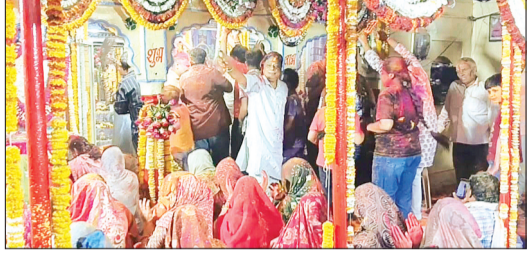
गुना। खाटू श्याम मिश्रमंडल द्वारा सत्यनारायण मंदिर में गुनावा होली मिलान समारोह।

राधोगढ़ | मुंगवली | आरोन | चाचौड़ा | कुंभराज | ब्यावरा | सारंगपुर | नरसिंहगढ़ | खिलचीपुर | जीरापुर | चंदेरी | नईसराय | ईसागढ़