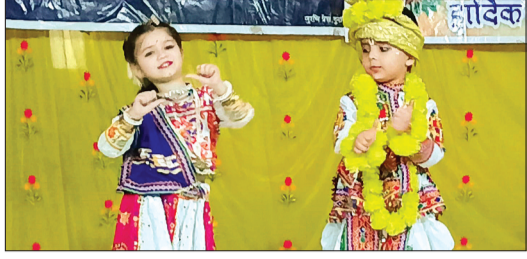
गुना। ब्राह्मण समाज ने गुनावा अंतरराष्ट्रीय महिला दिवस, रंगारंग कार्यक्रम किया।