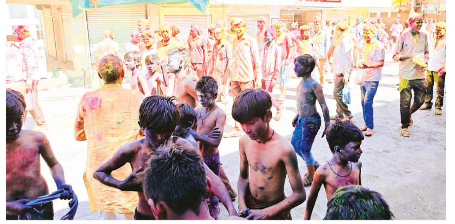
हरिभूमि न्यूज ►► छापीहेड़ा

प्रतिवर्ष की भांति रंगों की रंगरलिया एक दूसरे के साथ अटखेलिया खेलने का मजा तो सिर्फ रंग पंचमी के दिन ही पूरा होता है क्योंकि लोग कई दिनों पहले से इस त्यौहार के इंतजार का इंतजार करते हैं छापीहेड़ा में नन्हे नन्हे बच्चे रंगों से भरी पिचकारीया बंदूके लेकर रंगों के गुब्बारे एक दूसरे पर फोड़ने का कार्य इस दिन निरंतर जारी रखते हैं नगर के सभी प्रयुद्ध जन लोग एकत्रित होकर डीजे के साथ तथा नपा की फायर ब्रिगेड की पानी की धार के साथ नाचते गाते एक दूसरे को रंग लगाते हुए बस स्टैंड से रवाना होकर तालाब परिसर पाटीदार मोहल्ला कुशवाह काची मोहल्ला के दरकिनार होते हुए स्वर्णकार गली के माध्यम से बाजार चैक श्री राम मंदिर परिसर के आन्-बाजू नाचते हुए इस त्यौहार में मनोरंजन