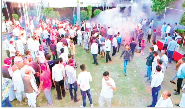
हरिभूमि न्यूज़ | चाचौड़ा

चाचौड़ा विधानसभा क्षेत्र में होली के पावन पर्व के उपलक्ष्य में भव्य होली मिलन समारोह का आयोजन किया गया। इस अवसर पर पार्टी के सम्मानित पदाधिकारी, समर्पित कार्यकर्ता एवं क्षेत्र के गणमान्य नागरिक बड़ी संख्या में उपस्थित रहे। कार्यक्रम में क्षेत्रीय विधायक प्रियंका पेची भी शामिल हुईं और उन्होंने सभी कार्यकर्ताओं एवं उपस्थित जनो से आत्मीय भेंट कर उन्हें होली पर्व की हार्दिक शुभकामनाएं दीं। कार्यक्रम में विधायक प्रियंका पेची ने कार्यकर्ताओं से मिलकर गुलाल लगाकर उनका स्वागत किया और उनसे संवाद भी किया। कार्यक्रम में चाचौड़ा विधानसभा क्षेत्र के साथ-साथ कुंभराज, मकसूदनगढ़ और गुना क्षेत्र की विभिन्न पंचायतों से भी