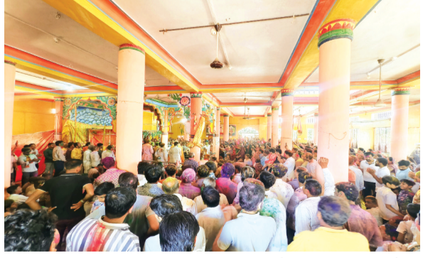
►► छापीहेड़ा